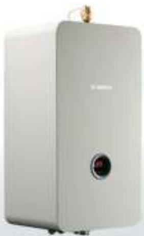
Tronic Heat 3000/3500

Разом з Tronic Heat 3000 або 3500 ви вибираєте конструкцію з найкращих матеріалів та прива-