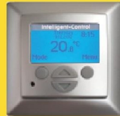
Intelligent Control Silver